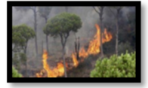
حِمَايَتُهَا مِنَ الْحَرَائِقِ