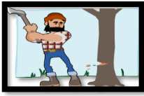
حِمَايَتُهَا مِنَ التَّحْطِيبِ

غَرَّاسَةُ الْأَشْجَارِ - سَقْيُ الْأَشْجَارِ - حِمَايَتُهَا مِنَ التَّحْطِيبِ - حِمَايَتُهَا مِنَ الْحَرَائِقِ